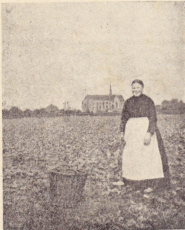
Een zinnelooze aan den arbeid. -- In het verschieft de Ste-Dymphnakerk.

De arme Dymphna, ten einde raad, vluchtte met haar biechtvader, den vromen Gerebernus, naar de kust, scheepte zich in, en landde in een kleine